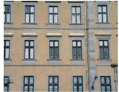
Fig. 1 - Substituição de revestimentos em edifícios antigos: usando materiais com características muito diferentes; usando materiais semelhantes aos antigos