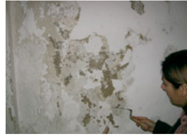
Fig. 8 - Humidade em paramentos interiores de edifícios antigos, devidas a capilaridade ascendente