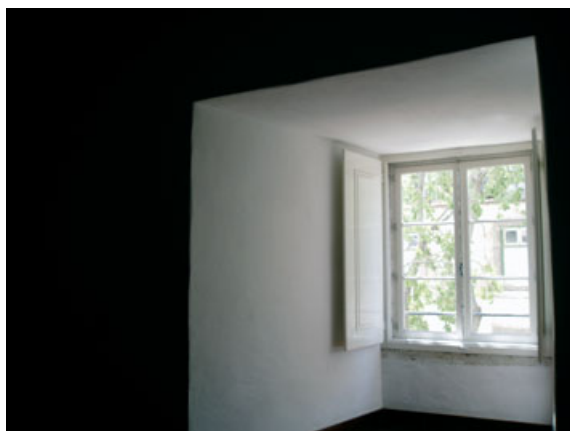
Fig. 7 - Parede antiga com grande espessura (convento em Lisboa)