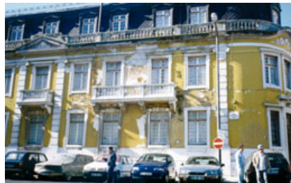
Fig. 5 - Palácio brasileiro do séc. XIX e edifício em Lisboa: repintura com membrana com degradação