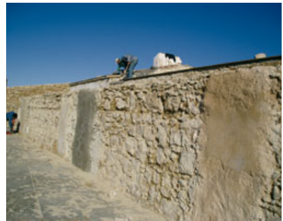
Fig. 10 - Argamassas com diversas pozolanas: provetes e painéis experimentais