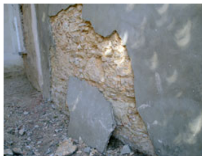
Fig. 6 - Camadas de acabamento de substituição de cimento: destacamento e degradação da base