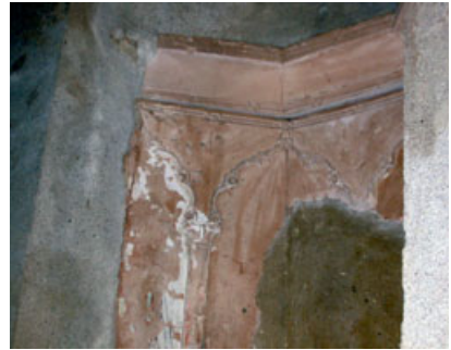
Fig. 9 - Humidade em paramentos interiores de edifícios antigos, devidas a capilaridade ascendente