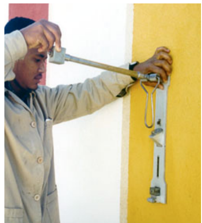
Fig. 12 - Aplicações experimentais de tintas de silicatos