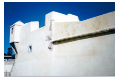
Fig. 2 - Substituição de revestimentos em Fortes perto de Lisboa: usando materiais com características muito diferentes; usando materiais semelhantes aos antigos