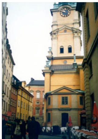
Fig. 11 - Pinturas de cal no Centro Histórico de Estocolmo