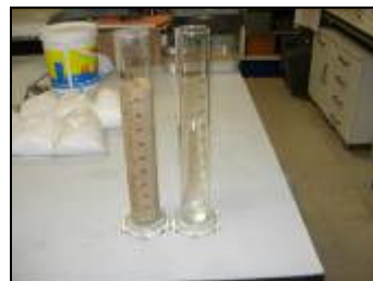
Figura 4 - Areia saturada e volume de água dispendido.

Na tabela 1, são apresentados os resultados de alguns ensaios realizados. A areia do rio Tejo, A1, tem uma baridade ligeiramente inferior à areia de Corroios, A2, e apresentou um maior volume de vazios. Ambas as areias têm um volume de vazios eleva-