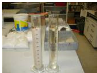
Figura 3 - Início do ensaio com iguais volumes de areia e de água.