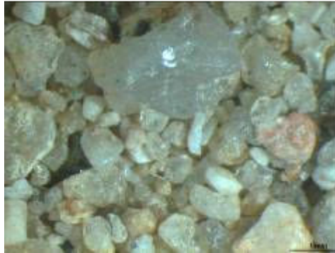
Figura 1 - Observação da areia do rio Tejo. Grãos angulares de dimensões variáveis e aparentemente limpa.

Scotland, 1995), considerou-se adequada a areia ou mistura de areias com uma percentagem de volume de vazios entre 30 e 35%.