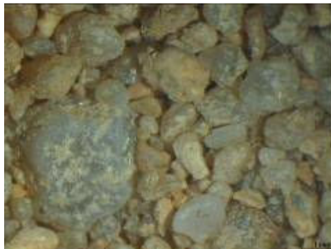
Figura 2 - Observação da areia de Corroios. Grãos entre as formas sub-angular e arredondada, de dimensões variáveis e com muitas partículas finas.